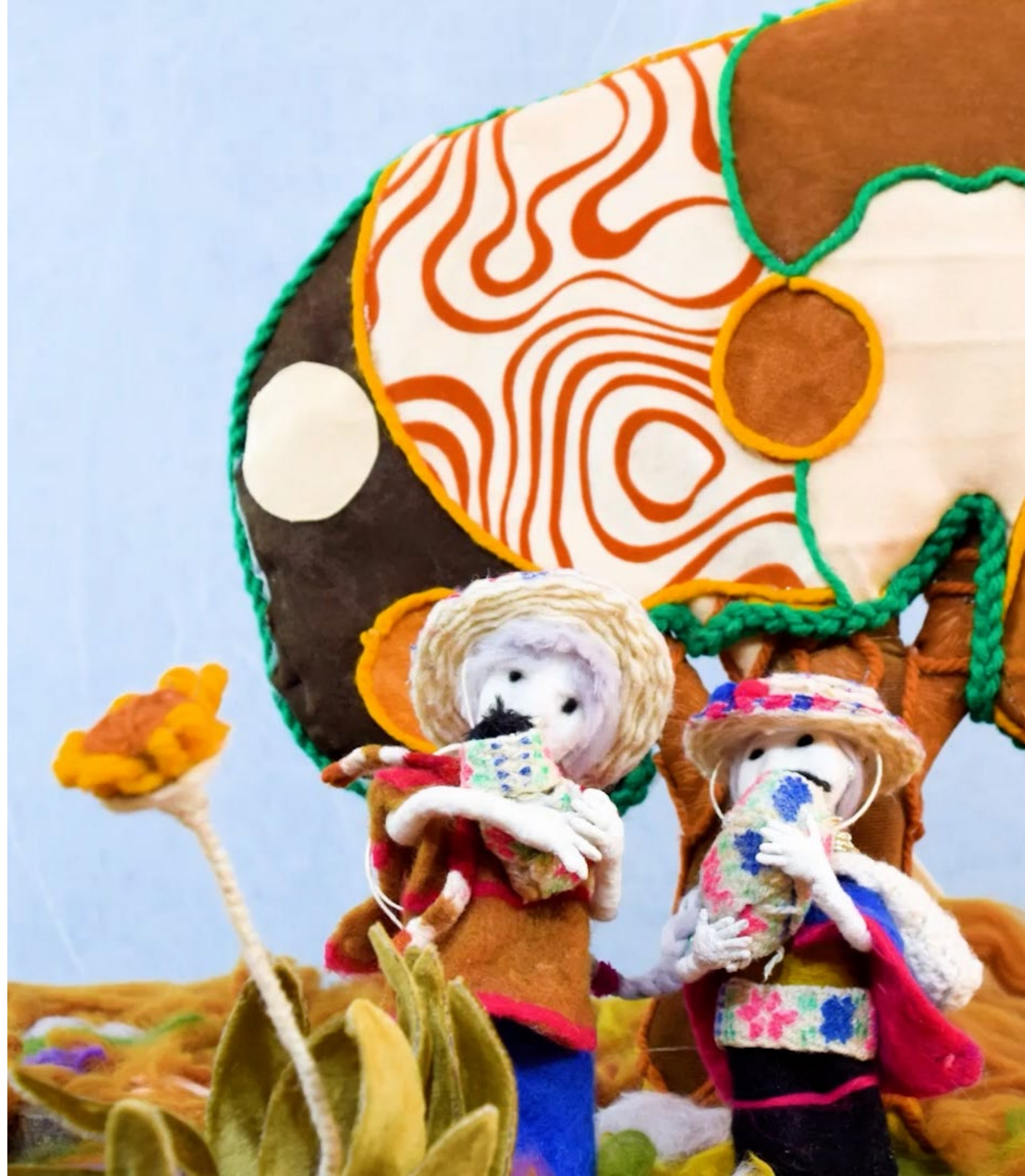
Imagen del contenido Piurek, hijos del agua. Cocreación del Programa "Nidos: Arte en primera infancia" con la comunidad misak y la Casa de Pensamiento Intercultural Misak Shush Urek. Bogotá, 2020

A continuación, compartiremos los relatos de algunos artistas que han vinculado a sus creaciones estos materiales.