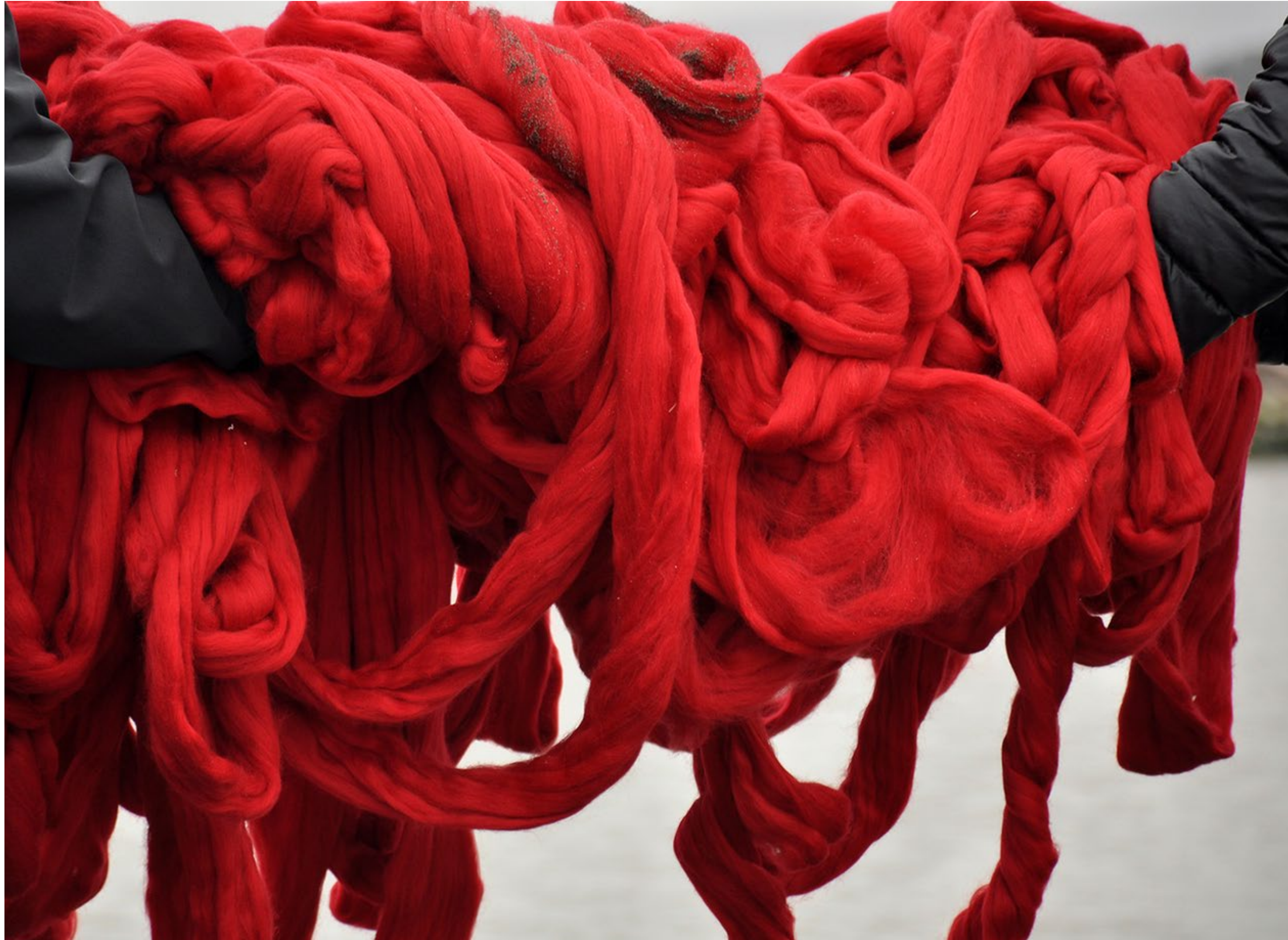
Cecilia Vicuña, Quipu Mapocho. Lana teñida, 2016.