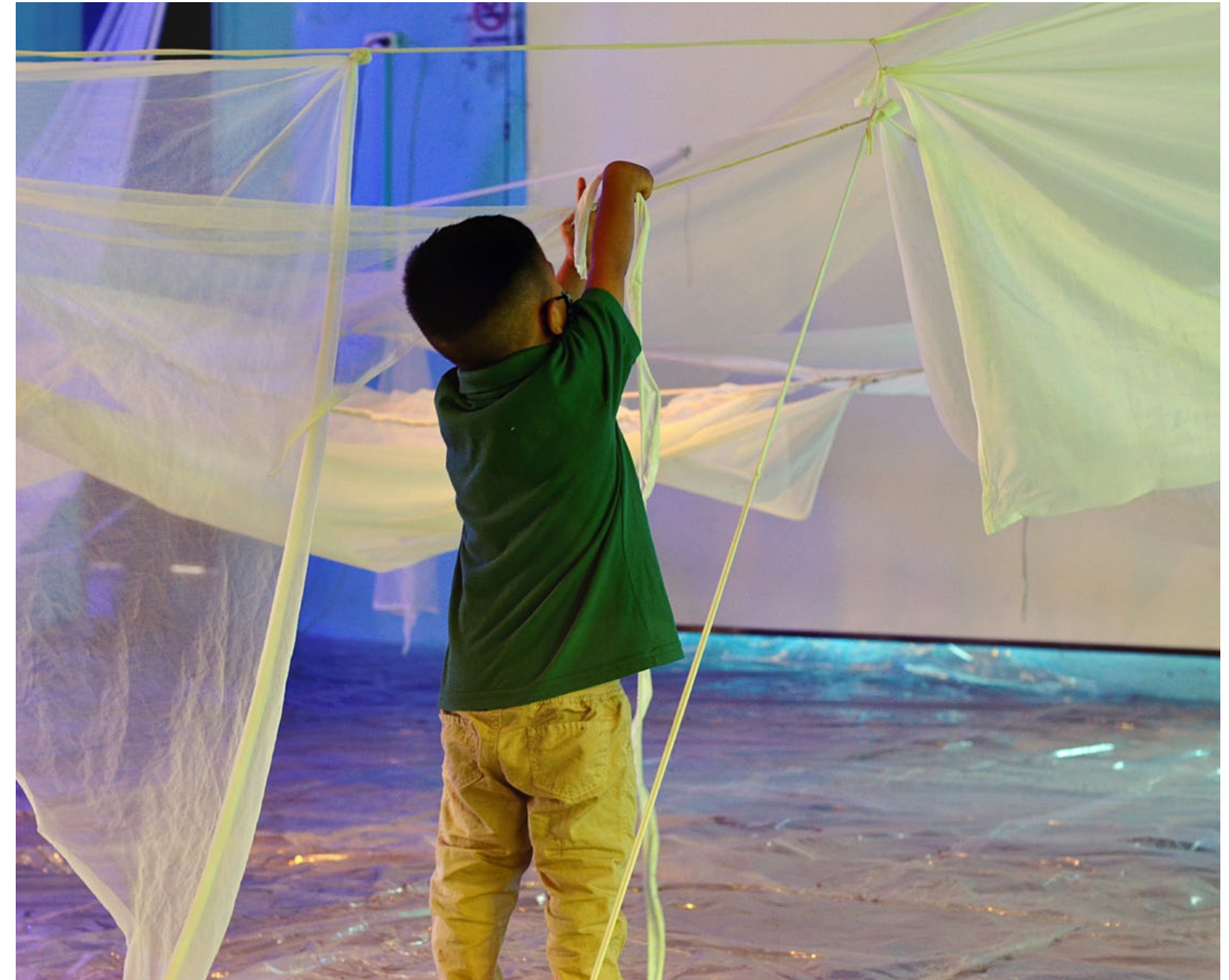
Un niño participando en la experiencia artística “Refugio cosmos”.

La experiencia artística “Refugio cosmos” propició en las niñas y niños la construcción colectiva de arquitecturas efímeras con el hilo tela o trapillo, a partir de la invitación a crear un refugio en una noche de campamento en la selva, para lo cual debían anclar y atravesar cordeles por varios orificios. El hilo se entregó en forma de madejas dispuestas en distintos lugares del espacio. Con ellas, los participantes tejieron sus refugios.