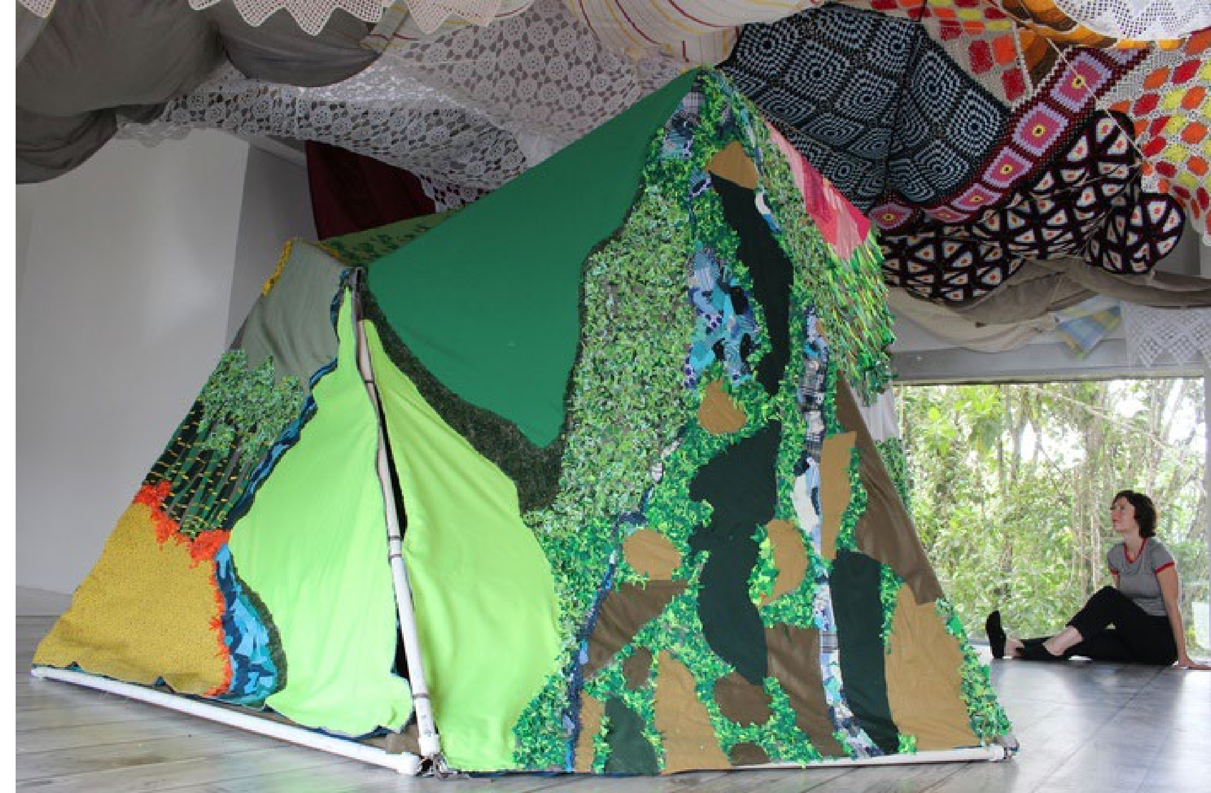
Angélica Teuta Montaña escarpada, carpa montada. Material textil, 2018