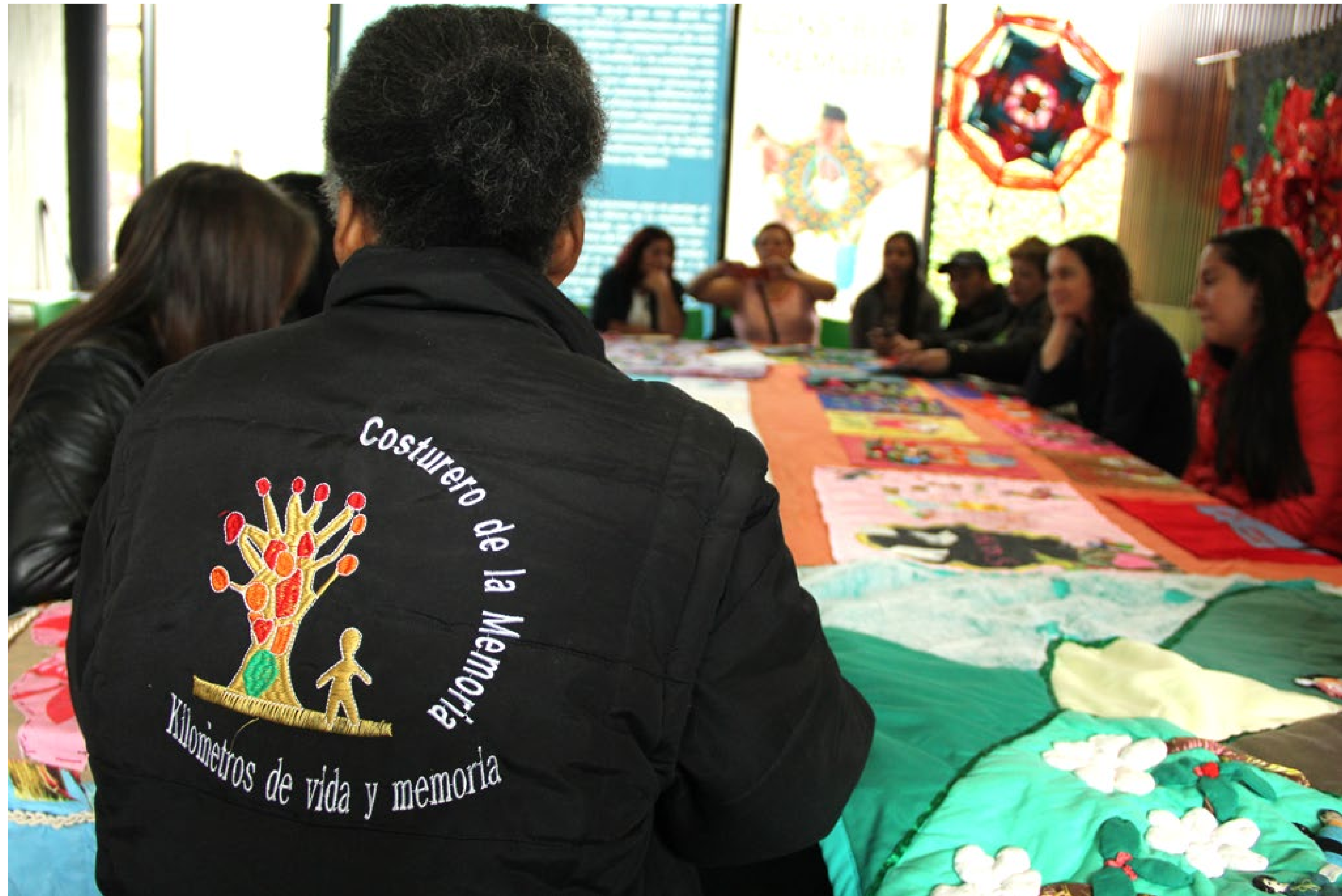
El costurero de la memoria