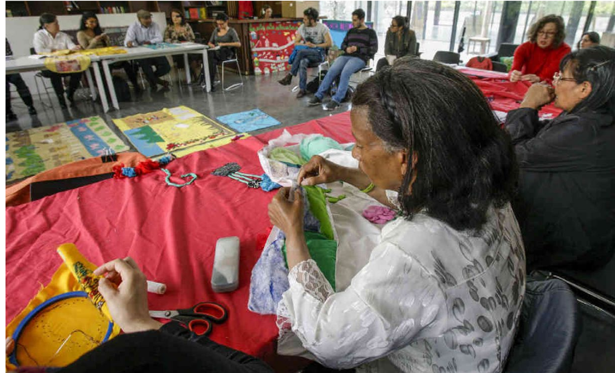
Costurero de la Memoria