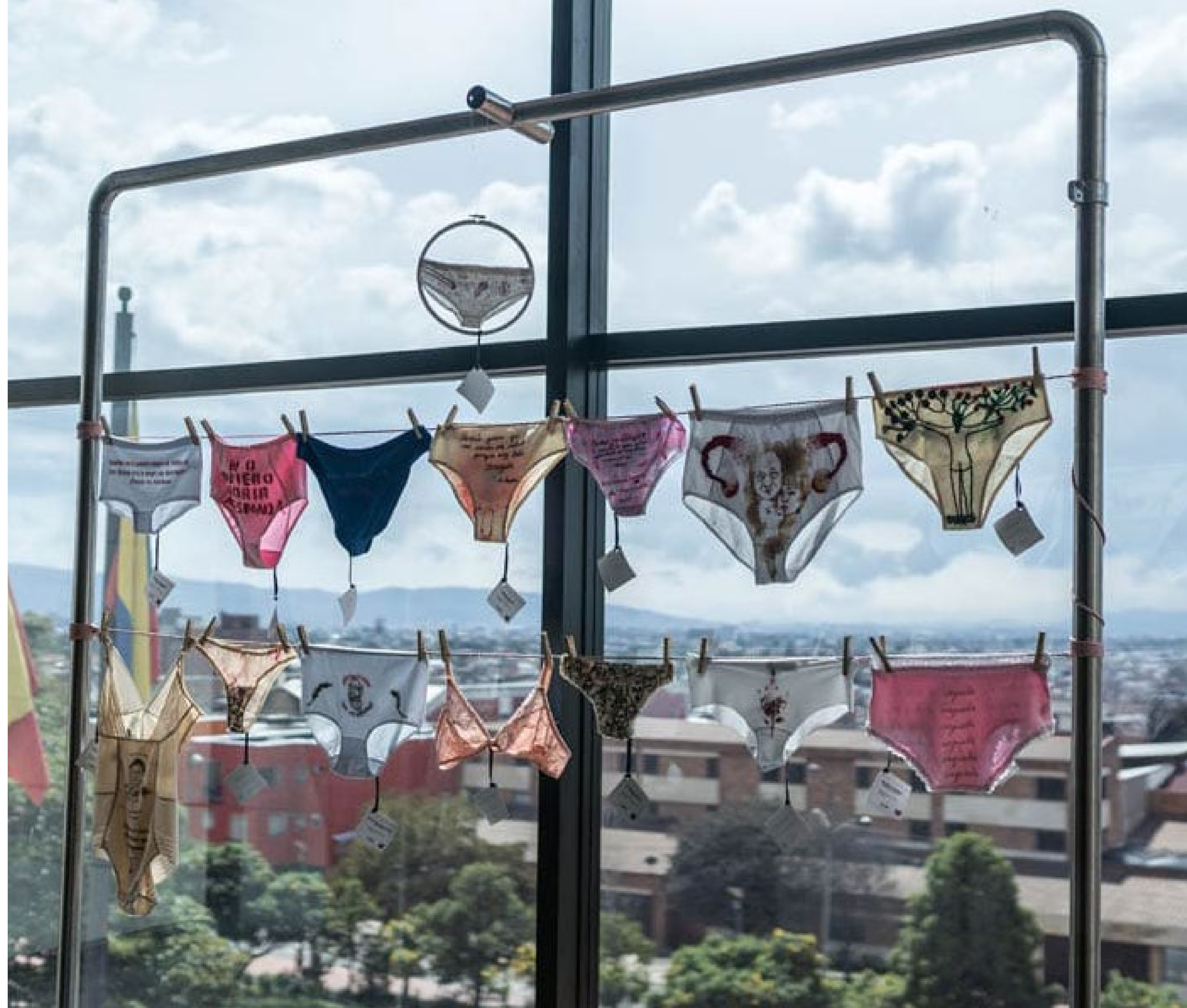
Imagen de la exposición "Manifiesto del brasier y solo cuco" en el Archivo Distrital de Bogotá 2021