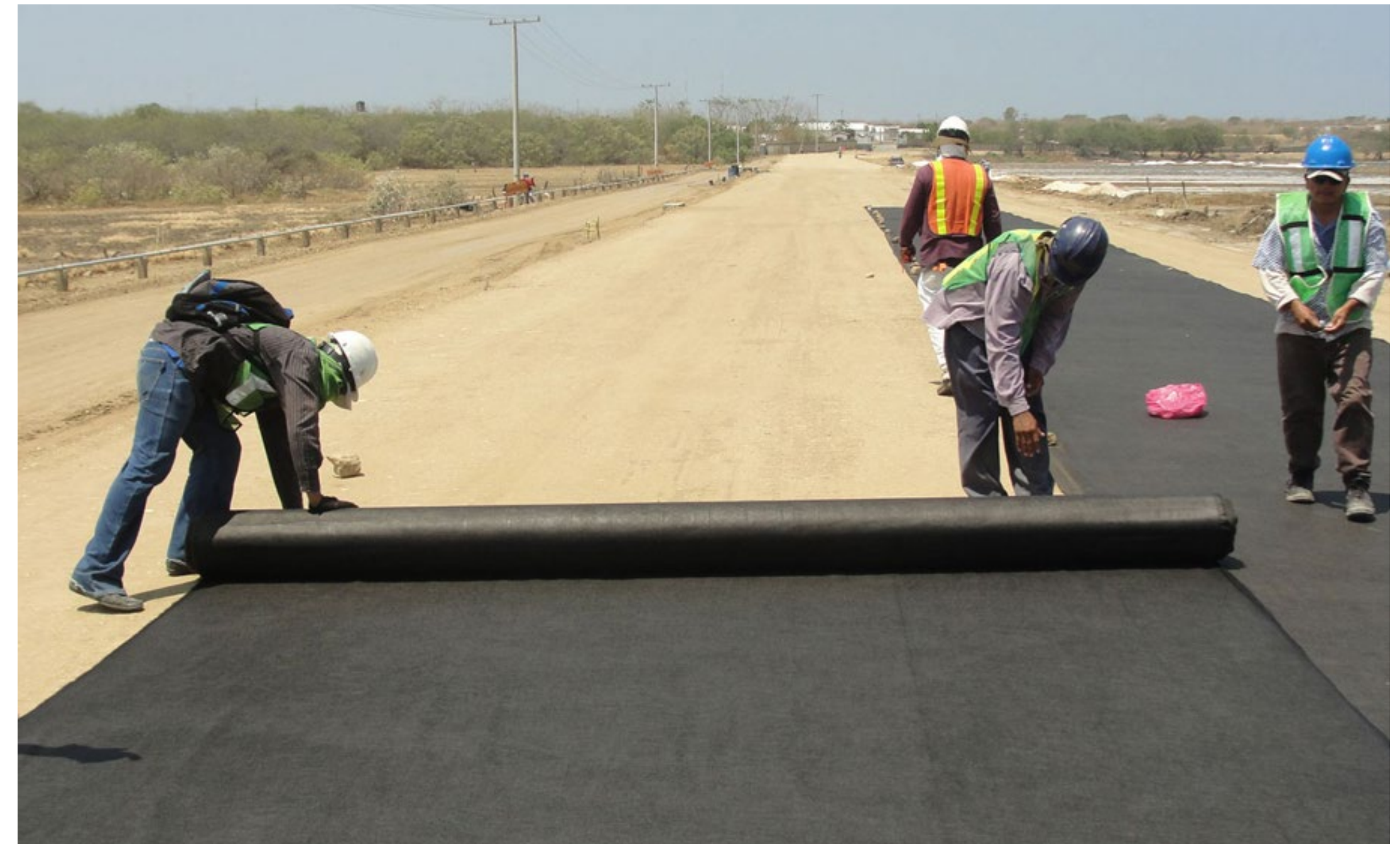
Uso de mantas sintéticas en la obra civil.

Durante siglos, los textiles se han confeccionado a partir de las fibras conocidas en cada época. Por ejemplo en un momento de la historia, las prendas de vestir de algunas comunidades estaban hechas sobre todo de lana de animales o a partir de fibras vegetales como el algodón o fique. Actualmente la inclusión de los polímeros en la fabricación de los textiles, ha generado una gran variedad de telas con diversas propiedades y usos. Es el caso de los geotextiles , un material utilizado para la construcción e impermeabilización de carreteras y vías férreas. Resistencia y capacidad de drenado, protegen el suelo y filtran el agua evitando hundimientos y huecos en el pavimento.