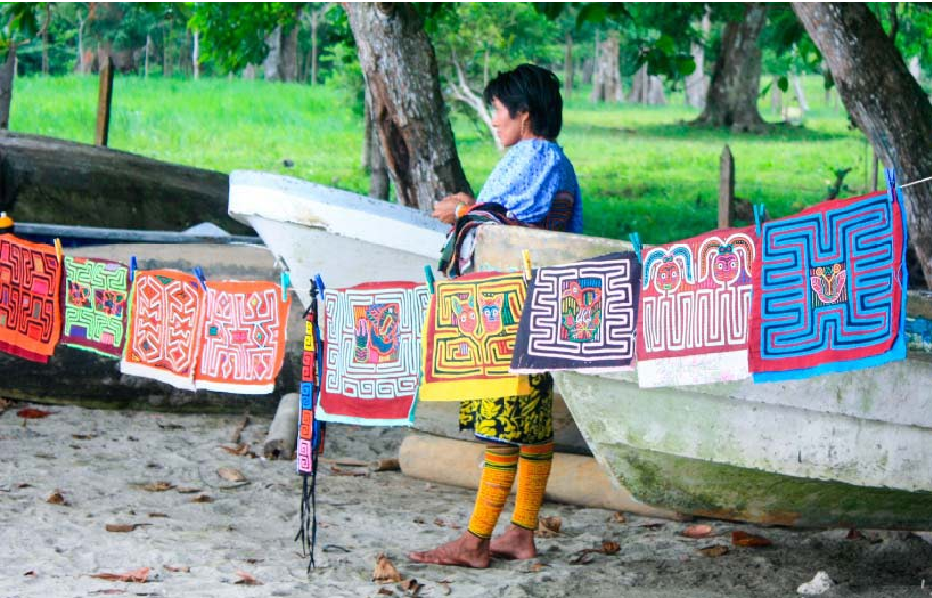
Mujer indígena de la etnia gunadule exhibiendo sus molas