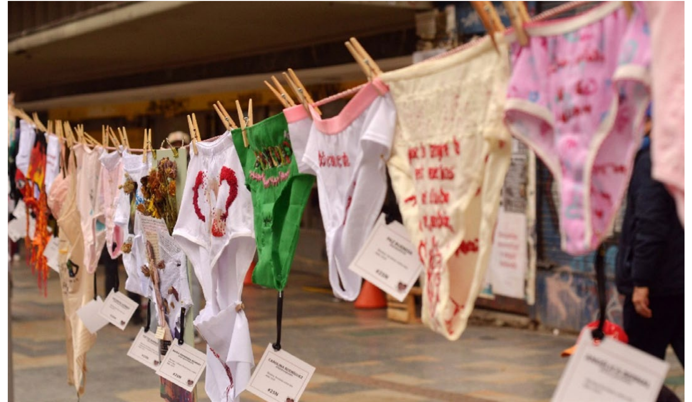
Imagen de la exposición “Manifiesto del brasier y solo cuco”.

“En la actualidad, cada vez más artistas están resignificando la técnica del bordado, a algunas se les ha etiquetado de anticuadas y han sido acusadas de retroceder por la función represiva que este ha representado históricamente, pero es justo la resignificación de la técnica lo que conlleva a una revolución estética: cuando el bordado se realiza de manera colectiva y con una posición política clara, no solo se tiene un objeto de arte, se tiene un objeto político y de protesta feminista. Ardidias logró resignificar el bordado, empezó haciendo talleres sobre la técnica y después el proyecto se expandió como una exposición del trabajo de varias mujeres artistas y creativas”.